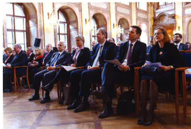
Slavnostní setkání v historických prostorách Valdštejnského paláce